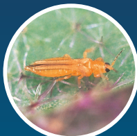
ミナミキイロアザミウマ