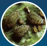
ニセダイコンアブラムシ