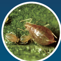
モモアカアブラムシ