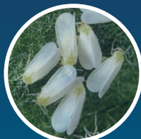
オンシツコナジラミ