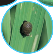
イネドロオイムシ