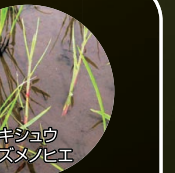
キシュウスズメノヒエ

ノビエ、SU抵抗性雑草(コナギ、ホタルイ)、難防除多年生雑草(クログワイ、オモダカ、コウキヤガラ)、多年生イネ科雑草(キシュウスズメノヒエ、エゾノサヤカグサ)に有効です。