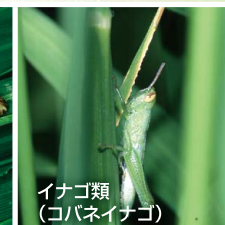
イナゴ類 (コバネイナゴ)