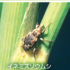
イネミスソウムシ