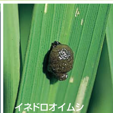
イネドロオウムシ